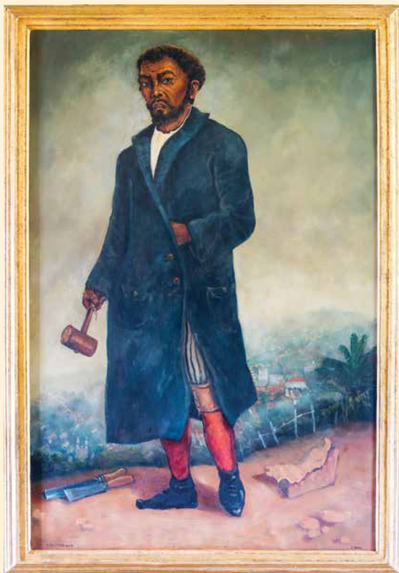
Pintura óleo sobre tela O Aleijadinho - Elias Layon - 2015 A exposição ocorre na igreja de São Francisco de Assis, Paróquia Nossa Senhora da Conceição, em Ouro Preto.